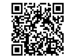
認識閱讀障礙影片

學習障礙有各種不同的類型，每一類型又有不同的特徵。以下的特徵並不是每個學習障礙的孩子都會出現，孩子是否確實有學習障礙，還需由專家鑑定。