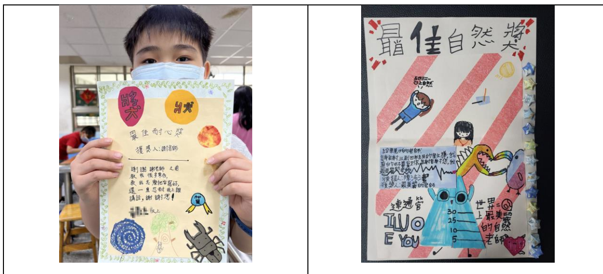
↑ 感謝師恩自製獎狀：每一張都是獨一無二的心意。