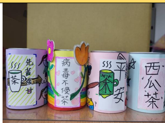
↑ 奉茶：特別的茶，給特別的您！