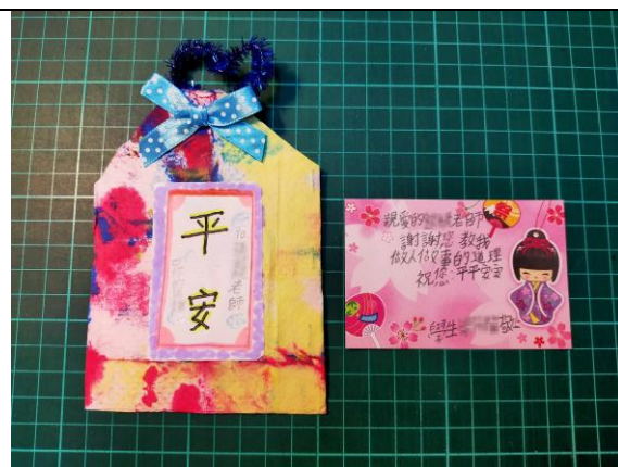
↑ 平安御守：每一份都充滿著對老師的感謝與祝福！