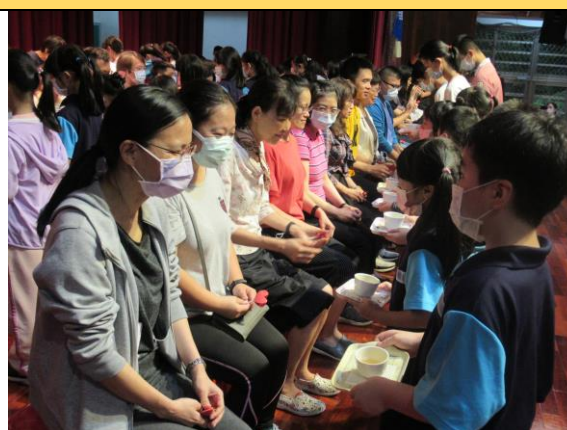
↑ 109 學年度教師節敬師奉茶儀式